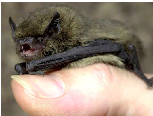
Zwergfledermaus ( Pipistrellus pipistrellus ).

Die Erfolgsrechnungen und Bilanzen der letzten Jahre finden Sie auf unserer Webseite www.pronatura-lu.ch/spenderinformationen .