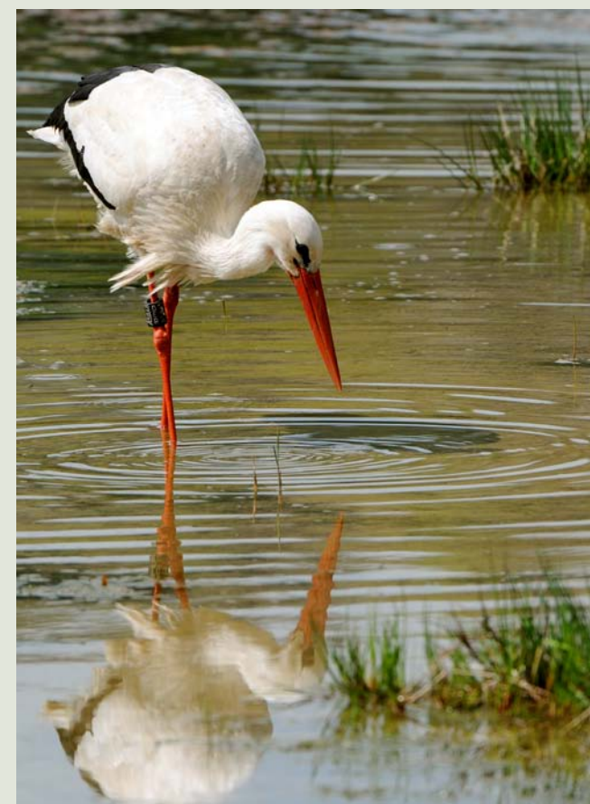
Weisstörche jagen in den Wiesen Regenwürmer, Heuschrecken und Mäuse. In Feuchtgebieten gehören auch Amphibien zum Speiseplan.

Weisstorch Einst brütete kein einziger Storch mehr im Kanton Luzern. Trockenlegung der Feuchtgebiete und Intensivierung der Landwirtschaft entzogen ihm jegliche Nahrungsgrundlage. Seit 2008 aber ziehen Störche wieder regelmässig im Seetal Junge auf. Für den Bruterfolg ist eine geringe Distanz zwischen Neststandort und Nahrungsbiotop (extensiv genutzte Wiesen, seichte Gewässer) wichtig. So sparen die Altvögel Energie bei der Nahrungssuche und die Jungen sind während der Aufzucht nur kurze Zeit alleine. Brütende Weisstörche können im Seefeld oder im Moos bestens vom Weg aus beobachtet werden. 2