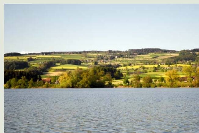
Blick über den See in Richtung Hohenrain

Der See ist im Luzerner Seetal aber auch ein wichtiges Naherholungsgebiet für die Bevölkerung. Damit ein erfolgreiches Miteinander von Mensch und Natur entstehen kann, gelten ein paar wichtige Regeln (siehe vorangehende Spalte). Denn das Ziel ist klar: Der Baldeggersee und seine Umgebung sollen auch künftig attraktiven Lebensraum für Menschen, Tiere und Pflanzen bieten.