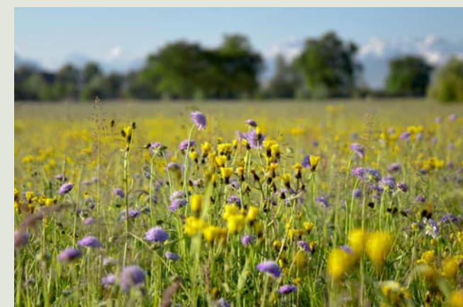
Auch in Zukunft setzt sich Pro Natura mit Aufwertungsprojekten und Pflegeeinsätzen rund um den See für eine vielfältige Kulturlandschaft im Seetal ein.

Naturnahe Lebensräume, die räumlich miteinander vernetzt sind, bilden eine intakte Landschaft und bieten ideale Bedingungen für viele Tiere und Pflanzen. Insbesondere bedrohte Arten sind auf vielfältige Lebensräume angewiesen. Darum hat Pro Natura gemeinsam mit Gemeinden, Landwirten und Freiwilligen diverse Ufergehölze, Schilfbestände und Riedwiesen gepflegt, Hecken und Hochstamm-Obstbäume angepflanzt, standortstypische Blumenwiesen gesät sowie neue Weiher, Stein- und Asthaufen erstellt.