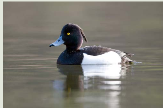
Viele Reiherenten überwintern auf dem Baldeggersee.

Iris sibirica Blühende Sumpfwiesen mit Beständen der Sibirischen Schwertlilie sind sehr eindrucksvoll. Jedoch haben Trockenlegung, Düngung und die Aufgabe der traditionellen Streunutzung der Sumpfwiesen die Pflanze fast zum Aussterben gebracht. Aus einem letzten Bestand im Seefeld wurden die Samen in den Aufwertungsflächen des Ronfelds erfolgreich ausgebracht. Im Mai und Juni kann die blühende Schönheit an beiden Orten beobachtet werden. 3