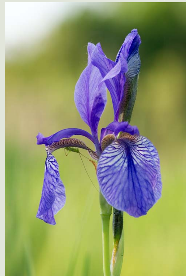
Leider ist die blauviolette Pracht der Iris sibirica in der Schweiz stark gefährdet.

Iris sibirica Blühende Sumpfwiesen mit Beständen der Sibirischen Schwertlilie sind sehr eindrucksvoll. Jedoch haben Trockenlegung, Düngung und die Aufgabe der traditionellen Streunutzung der Sumpfwiesen die Pflanze fast zum Aussterben gebracht. Aus einem letzten Bestand im Seefeld wurden die Samen in den Aufwertungsflächen des Ronfelds erfolgreich ausgebracht. Im Mai und Juni kann die blühende Schönheit an beiden Orten beobachtet werden. 3