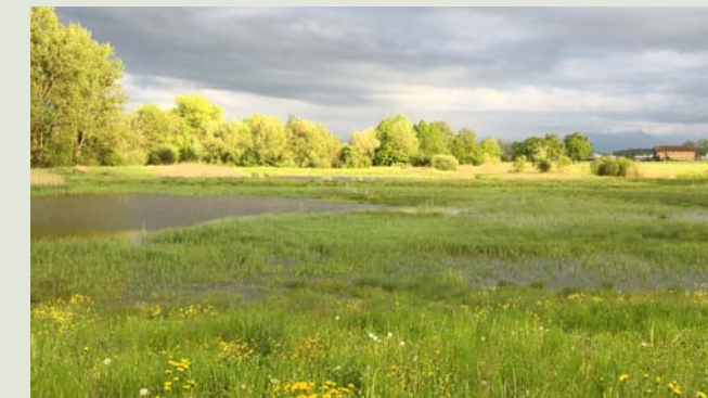
Die Flutmulden haben sich zu einem wichtigen Rastplatz für Zugvögel etabliert. Nicht selten können Raritäten beobachtet werden.

Naturerlebnispfad Pro Natura: Hochdorf–Badi Baldegg Einen faszinierenden Einblick in das vielfältige Naturschutzgebiet des Ronfelds bietet Ihnen die Beobachtungshütte (Hide) 5 bei Hochdorf.