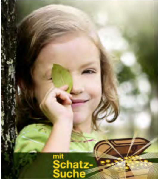
Den Wald und seine Geheimnisse entdecken.