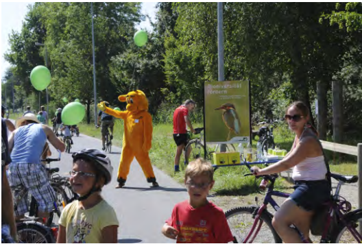
Pro Natura Luzern am SlowUp Seetal 2012.